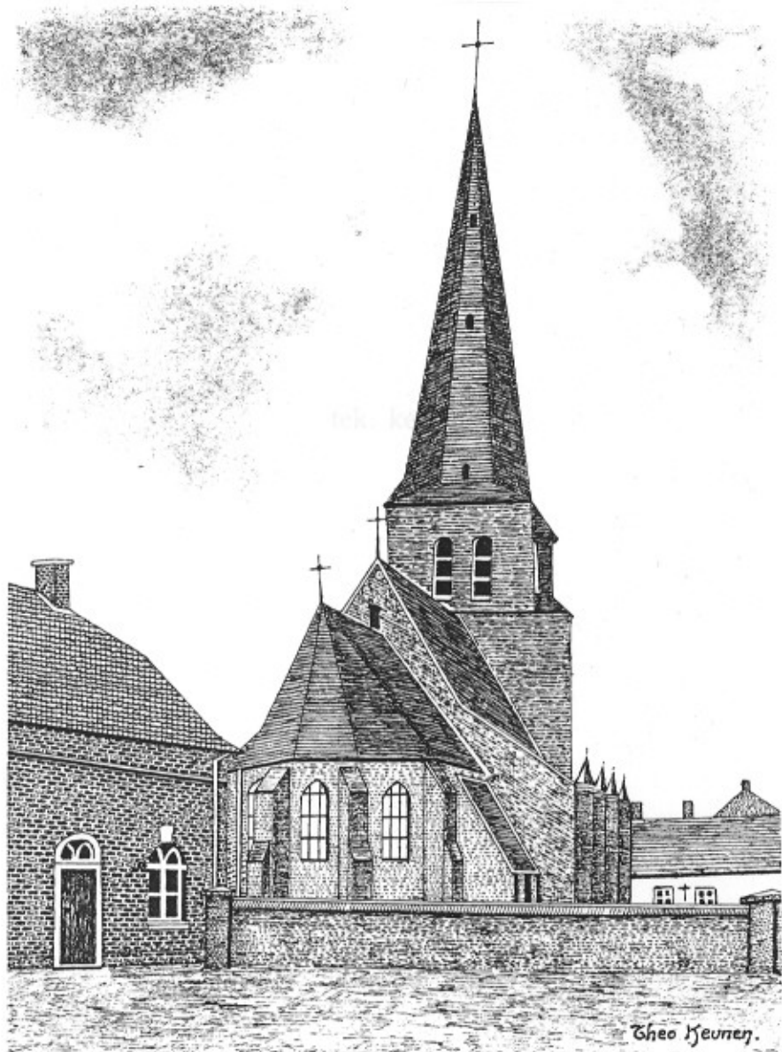
De kerk in de vorige eeuw, naar een tekening van Theo Keunen.