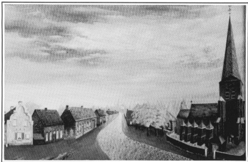
De St.-Nikolaaskerk in de vorige eeuw, naar een schilderij van Willem Swinnen.